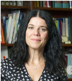
Patricia Lacruz Gimeno

Directora general de Cartera Básica de Servicios del Sistema Nacional de Salud y Farmacia